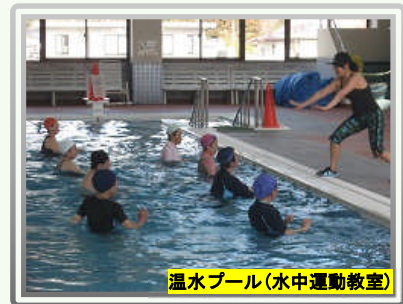
温水プール(水中運動教室)

医師紹介センターは、地域住民の健康を守るため、 国保直営診療所を重点に勤務医師の確保を行っております。 就職に係るご相談や求人者との調整等、誠心誠意ご対応いたします。